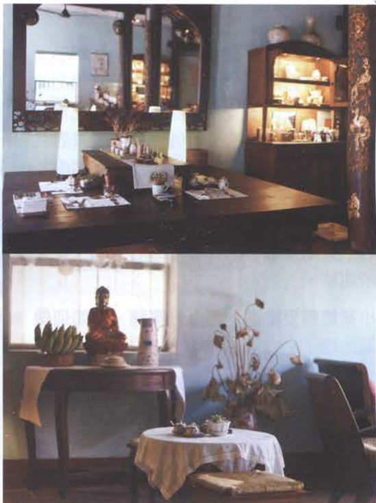
保留百年老屋的風華，並搭配相應的器皿、織品、老家具，和溫和的燈光。

外界往往認為身心障礙等同於能力的喪失（The Disabled），我的經驗卻是：擺放在對的位置，每個人都各有所